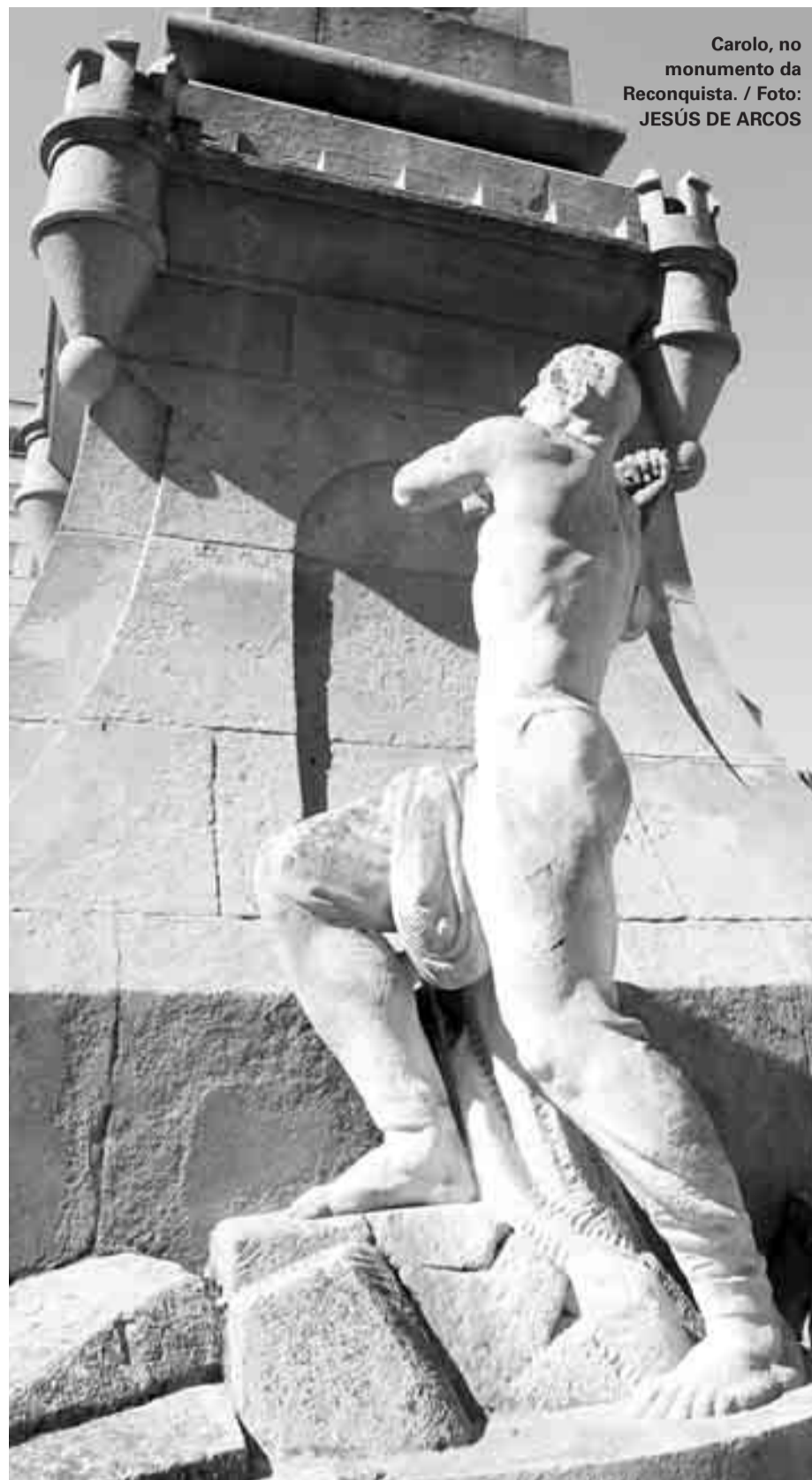
Carolo, no monumento da Reconquista.

A petición do abad de Valadares, Tenreiro e Almeida decidiron avanzar sobre Vigo, estreitando o cerco, instalándose en Lavadores, pese a non ter armamento pesado e únicamente as poucas armas de fo-