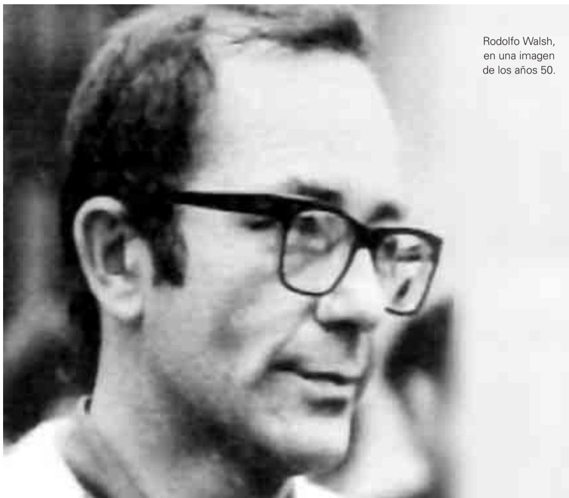
Rodolfo Walsh, en una imagen de los años 50.

En Operación Masacre presenciamos en estado puro la maquinaria, el pensamiento, de un Estado militar